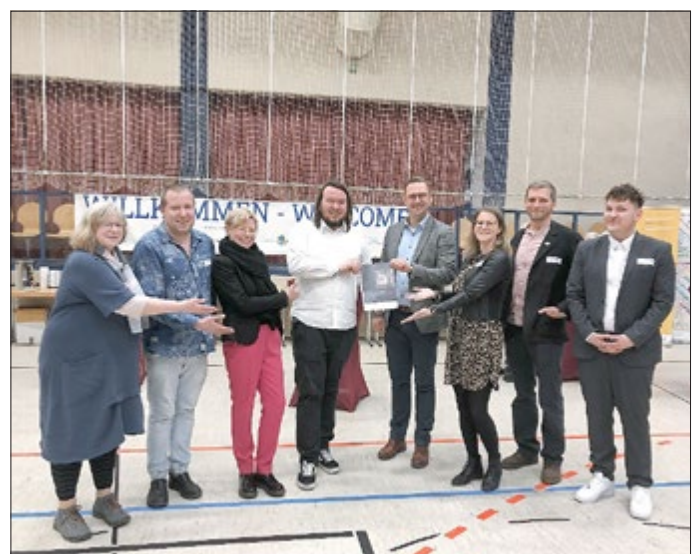
Übergabe des Entwurfes der Situations- und Ressourcenanalyse an die Partnerschaften für Demokratie