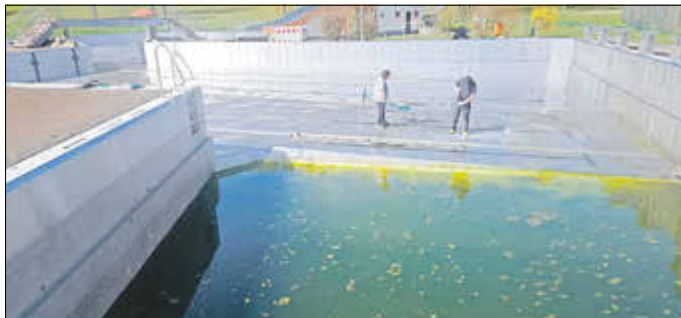
Hausmeister und Schwimmbadmitarbeiter bei den Reinigungsarbeiten.

Wir freuen uns, den diesjährigen Saisonstart des Mosbacher Waldbades bekanntzugeben: Am 23. Mai um 12.00 Uhr , öffnet das beliebte Freibad wieder seine Tore für alle Badegäste.