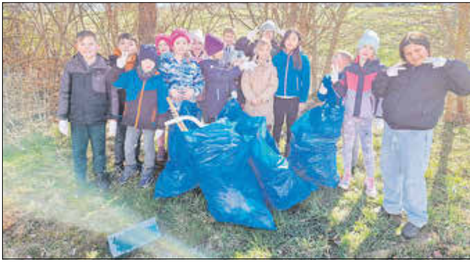
weitere Kinder der Grundschule