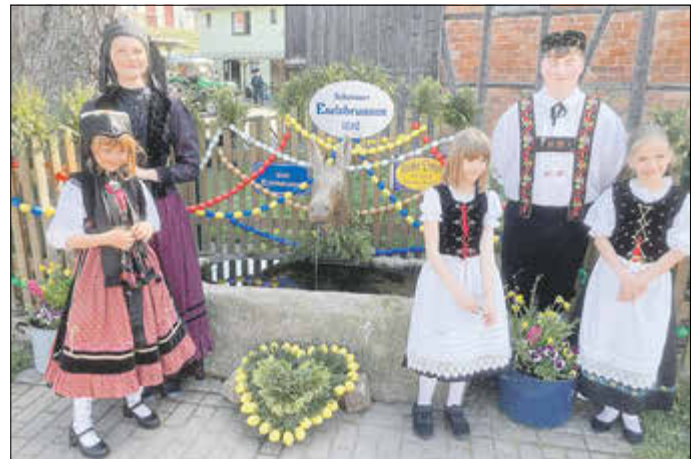
von den Backfrauen geschmückter Eselsborn mit Kindern der Trachtenjugend