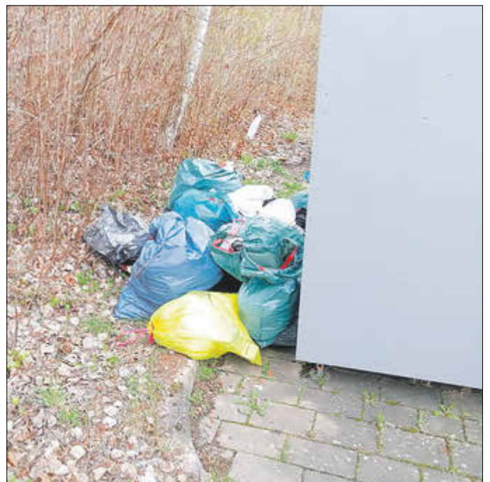
Müll an Kleidercontainern und verschiedenen Sammelplätzen