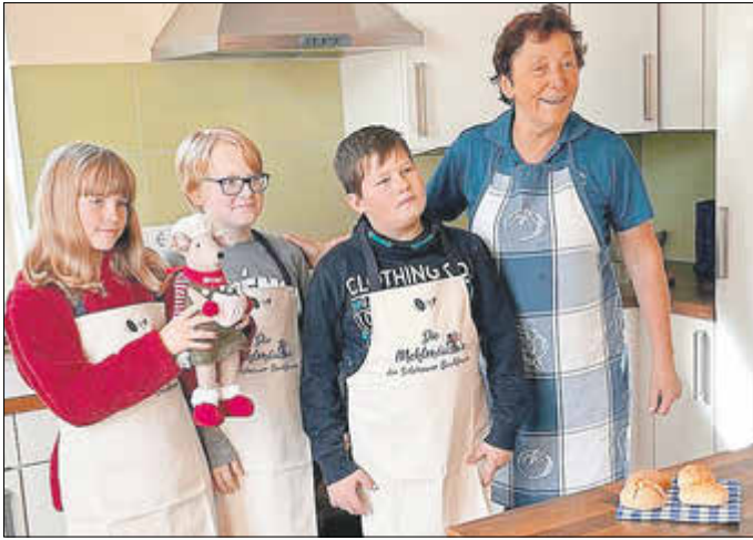
Schüler aus Gotha durften als erstes die neuen Schürzen tragen und die Mehlmaus Elli kennenlernen.

Trachtenjugend in Heldrungen zu treffen und Fotos am Eselsbrunnen für den Trachtenkalender 2026 zu machen. Als Eigenversorgung der gut 40 Jugendlichen wurde zum Mittag gemeinsam Pizza gebacken und für das abschließende Kaffeetrinken leckere Hefezöpfe ganz frisch aus dem Backofen geholt. Durch unsere Unterstützung der Osterferien-Aktion der Trachtenkinder ist unser Brunnen und auch der Backfrauen-Verein mit im Kalender 2026 festgehalten.