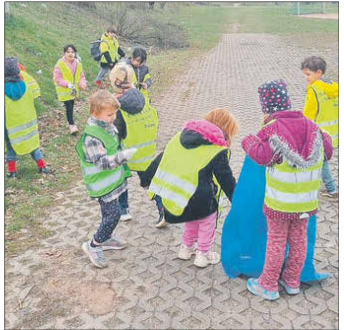
Kinder des Kindergartens Bambino beim Sammeln