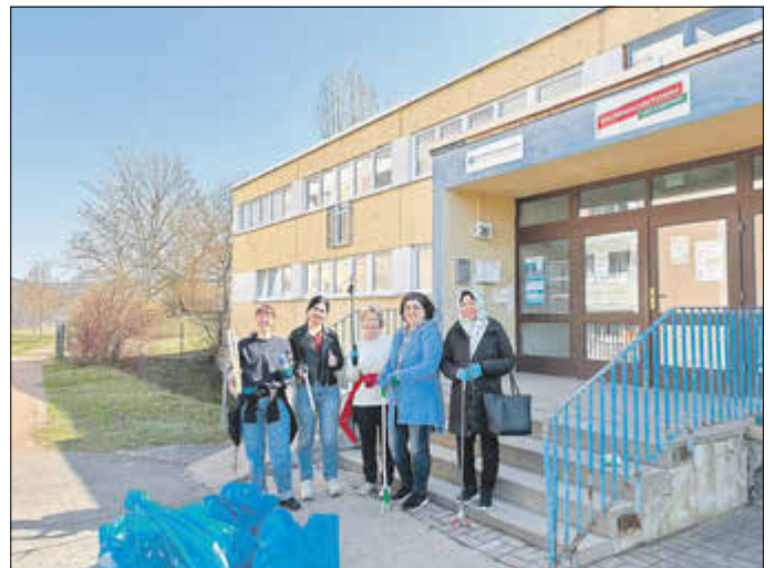
Frauen des Nachbarschaftstreffs