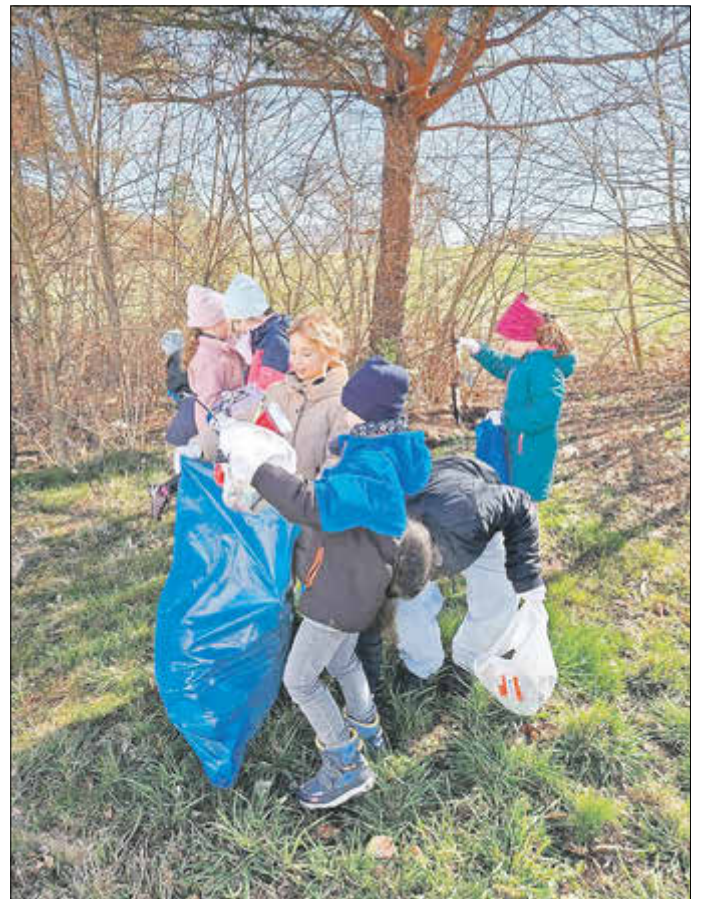
Kinder der Grundschule beim Sammeln

Auch der Bauhof war wie immer im Einsatz und leistete wichtige Nacharbeit. Allein in der zweiten Aktionswoche wurden an den Kleidercontainer-Standorten wieder etwa 20 Säcke Altkleider und Müll eingesammelt.