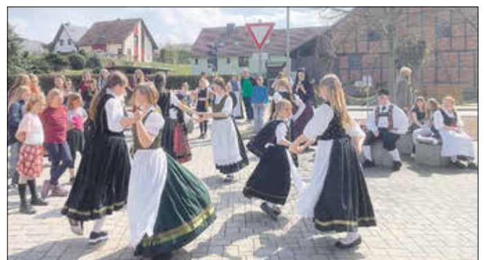
Der Tanz der Trachtenjugend an der Stegmann-Linde und am geschmückten Eselsborn waren der Höhepunkt der Osterferienaktion am 15. April 2025 in Schönau bei den Backfrauen.