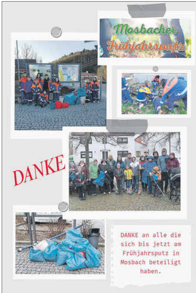
Frühjahrsputz in Mosbach