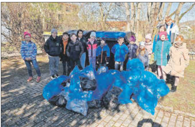
Kinder der Grundschule nach dem Müllsammeln

Das Ergebnis zeigt eindrucksvoll, wie viel gemeinsam erreicht werden kann. Allen Beteiligten gilt ein herzlicher Dank für ihren Einsatz für eine saubere und lebenswerte Gemeinde.