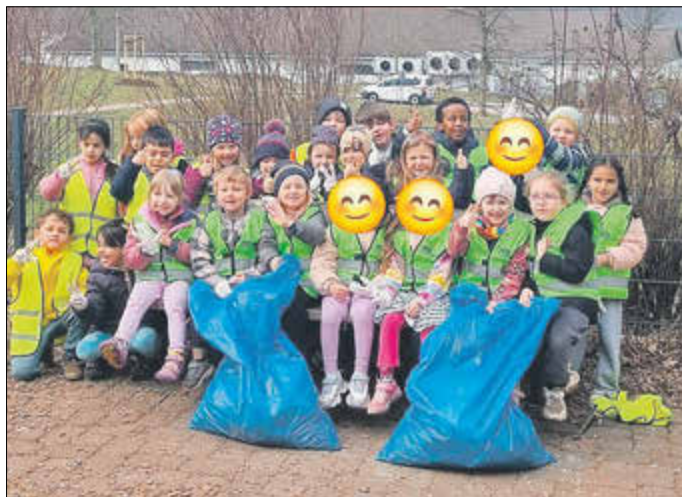
Kinder des Kindergartens Bambino beim Sammeln