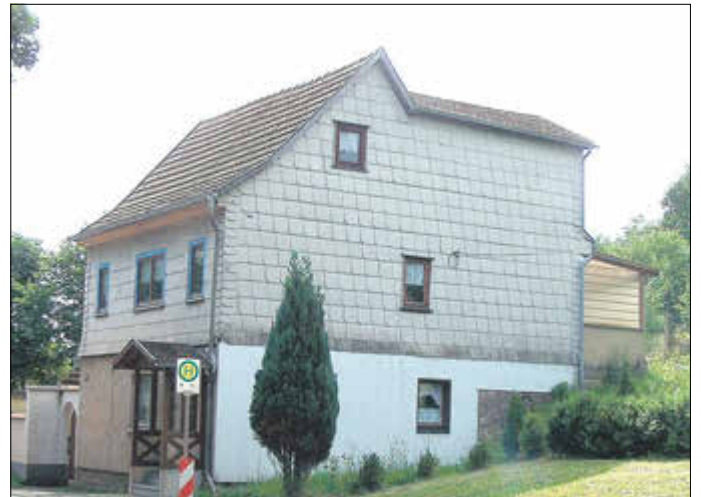
Das älteste Wohnhaus in Eichborn mit Bushaltestelle

Der Ort Sättelstädt war bis 1918 Bestandteil von Sachsen-Coburg-Gotha, wie auch Sondra, Kälberfeld und Kahlenberg. Schönau, Deubach, Farnroda, Eichrodt und Wutha waren Sachsen-Weimar-Eisenach zugehörig. Eine Grenzübergangsstelle mit Schlagbaum war folglich im Nahbereich vom Eichborn zur Kontrolle der Ein- und Ausreisenden erforderlich. Die beiden Thüringer Teilstaaten traten 1834 dem Zollverein bei, wodurch zumindest die zeitaufwendige Ermittlung und Kassierung der Zollgebühren aufhörte.