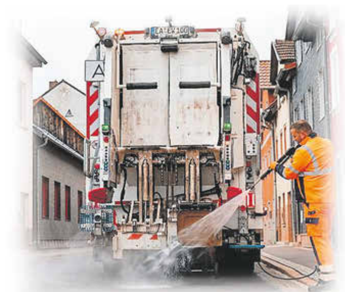
Das Waschfahrzeug des Abfallwirtschaftszweckverbandes Wartburgkreis - Stadt Eisenach (AZV) im Einsatz

Der Abfallwirtschaftszweckverband Wartburgkreis - Stadt Eisenach (AZV) startet im April 2026 erneut mit dem Frühjahrsputz der Biotonnen im gesamten Wartburgkreis.