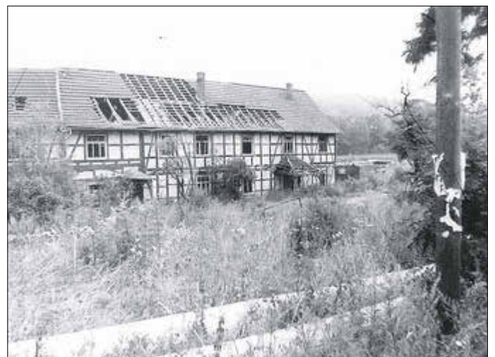
Der Rehhof im Jahr 1986.

Im Vorbeifahren am Rehhof konnte man noch Anfang der 1970er Jahre die stattlichen Wohn- und Stallgebäude, Scheunen und Schuppen, überwiegend in Fachwerkbauweise um einen weitläufigen Hof gruppiert, bestaunen. Auch die landwirtschaftliche Nutzung des ursprünglichen Rehhofes endete um 1990. Die letzten Familien wurden zum Teil auf den Mølmen umgesiedelt, die nun leerstehenden historischen Fachwerkbauten fielen in mehreren Abrisskampagnen. An gleicher Stelle entstand wenige Monate später das heute noch genutzte Betonmischwerk.