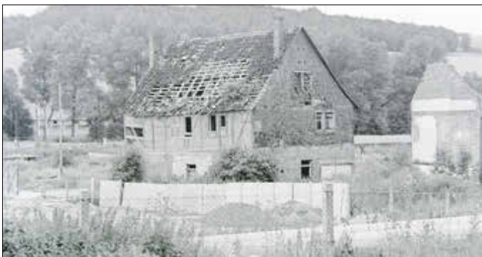
Der Rehhof im Juli 1991

Die Gemarkung von Wutha-Farnroda und der umliegenden Höhen haben zum größten Teil relativ magere Böden, diese sind aus verwitterten Buntsandsteinschichten entstanden, deshalb war es für die einstigen Bewohner immer sehr mühsam, ihr täglich Brot zu erarbeiten. Eine Ausnahme bildeten die Randbereiche entlang des Hörselufers, hier dominierte die Viehzucht: Rinder-, Schweine-, Geflügel- und Schafhaltung war auf den feuchten Uferwiesen und Weiden unproblematisch. An den einstigen Rehhof erinnert heute nur noch eine Bushaltestelle und das 1990 eröffnete Ausflugslokal „Rehhofstübchen“, es wurde schon 1929 als „Haus Wilhelmine“ erbaut.