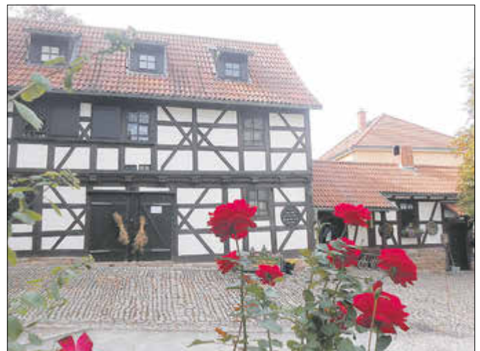
Herzliche Einladung zum 4. Hofcafé am Hörselbergmuseum.

Text & Foto: Christina Reißig, 1. Backfrau