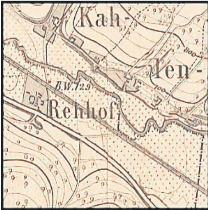
MTBL5028 Kartenausschnitt von 1873

Die östlichen Teile der Gemarkung Wutha (Flur 17 und 18) waren seit dem Mittelalter zum Rehhof gehörig. Der noch bis 1991 sichtbare Gebäudekomplex aus Fachwerkhäusern, Stallungen und Scheunen wurde aufgegeben, um das dort benötigte Betonmischwerk zu errichten. Mitte der 1980er Jahre lebten vier oder fünf Familien auf dem Rehhof.