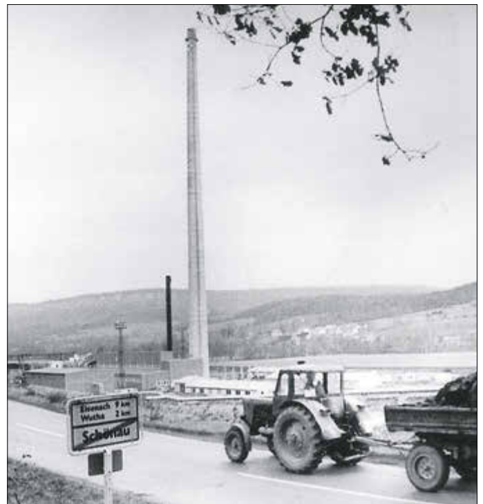
Die fast 100 m hohe Esse, einstmals die Landmarke im Hörseltal.

per Güterwagons beliefert, die beim Verbrennen entstandene Asche wurde in einer Schlucht am Gipfel des benachbarten Generalsberg deponiert. Damit war nach der Wende Schluss, das Heizwerk nutze dann bis zur Abschaltung Gasbrenner.