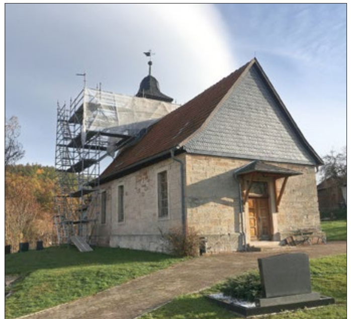
Gerüst an der Nordseite, um am gesamten Turm arbeiten zu können.