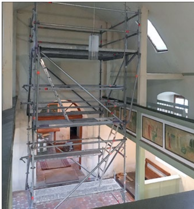
Gerüst innen, um beschädigtes Mauerwerk abzutragen und den Zugang zur Balkenkonstruktion am Fuße des Turmes zu ermöglichen