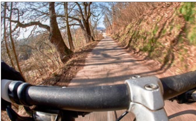
Die Sonne kam heraus, als ich mich dem Zapfengrund näherte.

Als ich losfuhr, war es sehr neblig. Ich nahm mein Fahrrad und sprang in Sättelstädt aus dem Zug. Ich bin den Radweg zwischen dem Bahnhof in Sättelstädt zum Bahnhof in Wutha und noch ein Stück weiter zum Bäcker gefahren, um etwas zu essen