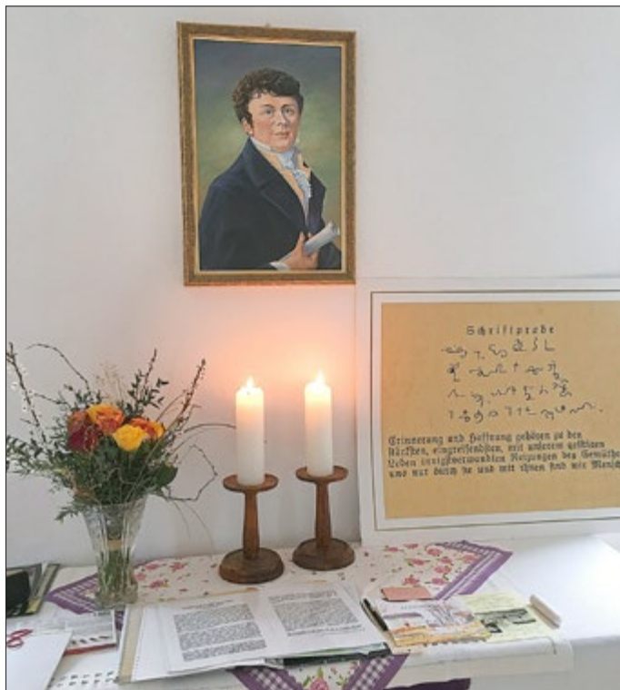
Würdige Feierstunde anlässlich des 250. Geburtstag von Friedrich Mosengeil im Schönauer Pfarrhaus.