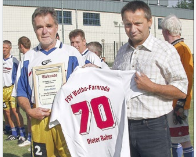
Verleihung Ehrenmitgliedschaft 2008