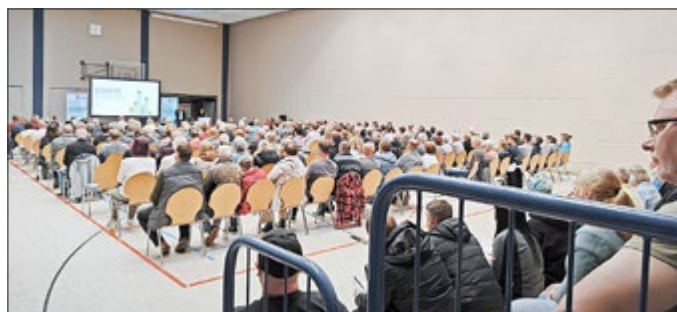
Infoveranstaltung Hörselberghalle 15.05.2023

Deutschland. Als Pionier und Schrittmacher der Branche plant, baut und betreibt Deutsche Glasfaser anbieteroffene Glasfaserschlüsse für Privathaushalte, Unternehmen und öffentliche Einrichtungen. Sie strebt als Digital-Versorger der Regionen den flächendeckenden Glasfaserausbau an und trägt damit maßgeblich zum digitalen Fortschritt Deutschlands bei. Mit innovativen Planungs- und Bauverfahren ist Deutsche Glasfaser der Technologieführer für einen schnellen und kosteneffizienten FTTH-Ausbau. Die Unternehmensgruppe zählt zu den finanzstärksten Anbietern im deutschen Markt und verfügt mit den erfahrenen Glasfaserinvestoren EQT und OMERS über ein privatwirtschaftliches Investitionsvolumen von sieben Milliarden Euro.