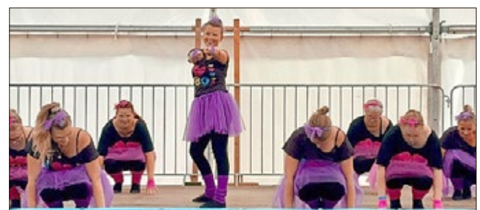
Unsere Showtanzgruppe „Flying Feet“ zur Kittelsthaler Kirmes