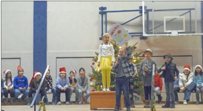
Auftritt der Klassen 2a+b der Grundschule „Am Rehberg“

Wir blicken voller Vorfreude auf eine gelungene Weihnachtsfeier im Jahr 2025.