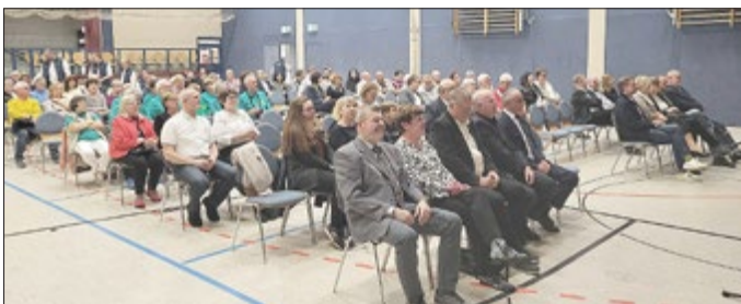
Publikum zur Festveranstaltung