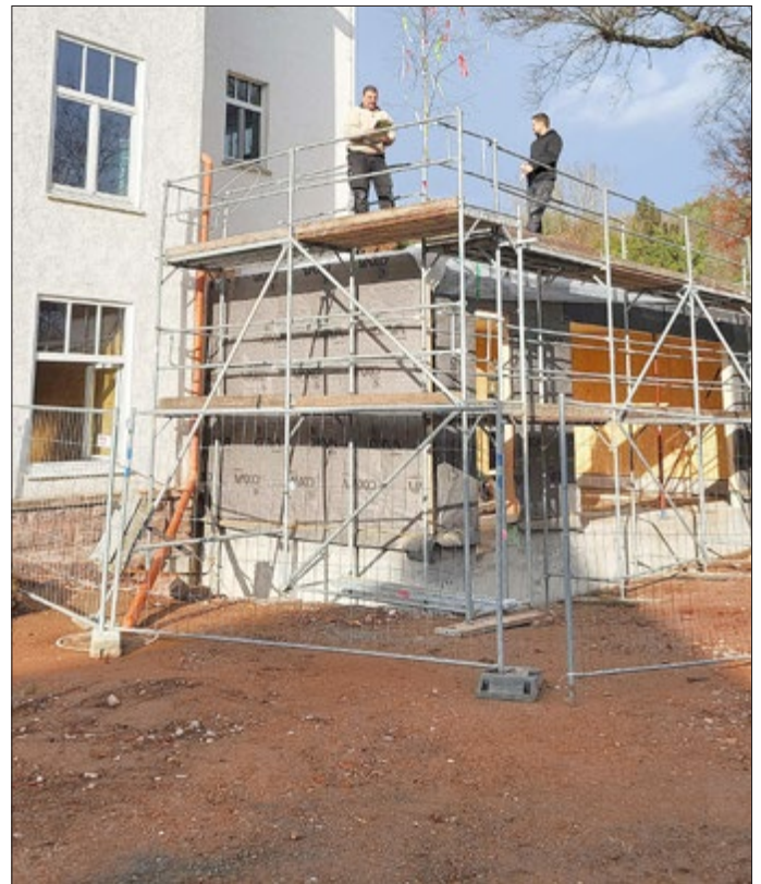
Zimmermann beim Richtspruch

Mit besten Wünschen! Die Zimmerei Dechant aus Braunsvalde!