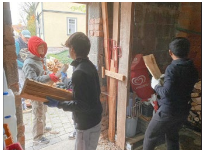
Es wurde den vier Schülern keine Minute langweilig bei den Backfrauen und sie kommen gerne wieder zum Helfen.