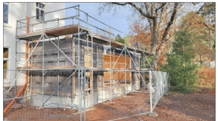
Anbau am Rathaus