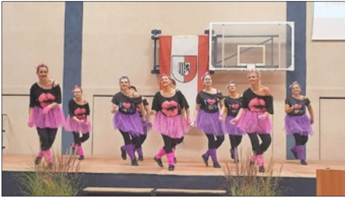
Tanzgruppe Flying Feet