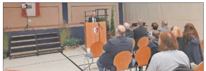
Begrüßung durch den Bürgermeister